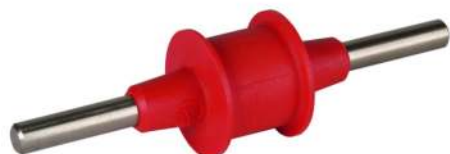
Fotografía no vinculante